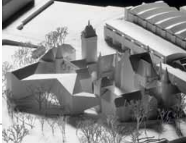
Modell Landesmuseum Zürich mit Erweiterung. © Christ & Gantenbein Architekten

Ein grosszügiges Auditorium für öffentliche Veranstaltungen sowie ein Studienzentrum für die Zusammenarbeit mit Schulen und Hochschulen sind Bestandteil der Erweiterung. Zur Limmat hin befindet sich die Bibliothek, die in Verbindung mit dem neuen Studienzentrum im Kunstgewerbeschulflügel steht. Der Neubau bietet zudem erstmals die erforderliche Gastronomieinfrastruktur für ein Museumsrestaurant. Auditorium und Museumsrestaurant können auch ausserhalb der Öffnungszeiten des Museums betrieben werden. Damit wird auch abends das Platzspitzareal belebt.